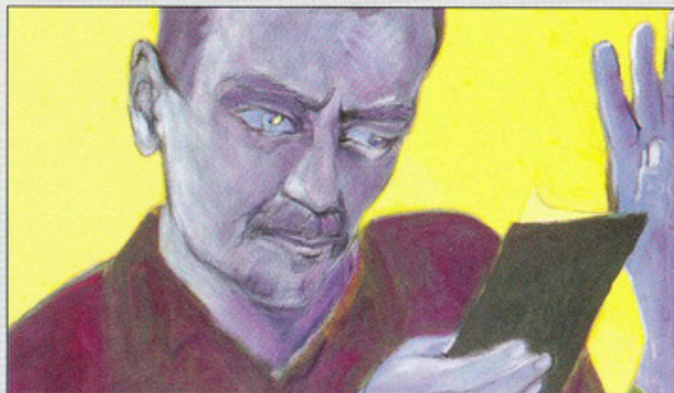
„Der Buddha und die Taube“